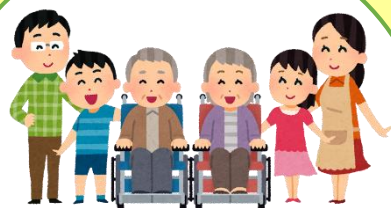
地域福祉のために！