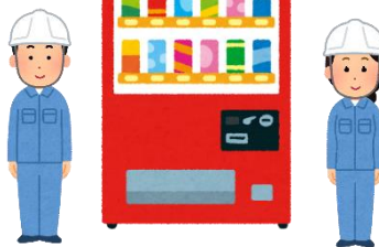
自動販売機の設置