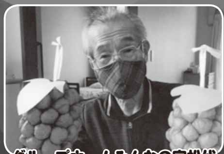
グループホームみんなの家松伏