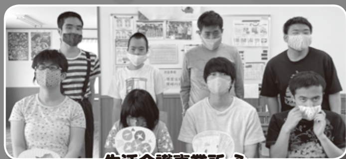
生活介護事業所 心

日頃、頑張ってくださいる方に感謝を込めて作りました。喜んでいただけたら幸いです。 50代女性