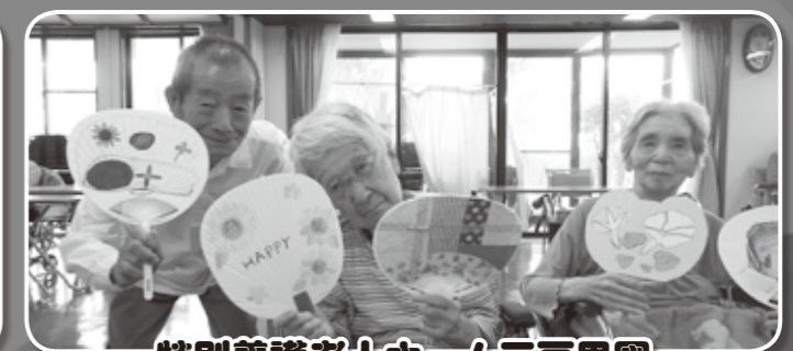
特別養護老人ホーム三戸里園