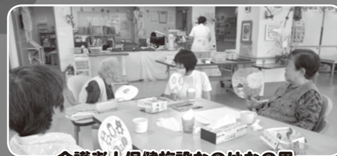
介護老人保健施設なのはなの里