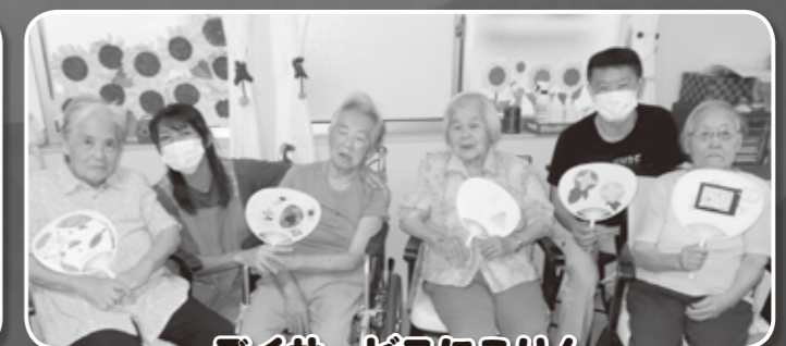
デイサービスにこりん