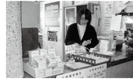
【中央公民館（エローラ）】（石けん）

心身障害者地域デイケア施設 松伏町立かるがもセンター 住所/松伏町田島 1524 TEL 992-4132 FAX 992-4135