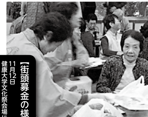
11月12日 「街頭募金の様子」 ●健康大学文化祭会場にて ●募金活動協力/松伏町赤十字奉仕団の皆様

皆様から寄せられました募金を下記の事業に活用させていただきました。ご協力ありがとうございました。 ☆歳末たすけあい援護事業 ☆歳末大掃除事業 ☆ひとり暮らし高齢者ふれあい会食会 ☆ひとり暮らし高齢者火災警報器設置事業 ☆ひとり親家庭図書カード配布事業 ☆友愛通信事業 ☆ひとり親家庭助成事業 ☆あったかギフト事業