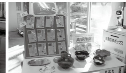
【老人福祉センター】（ビーズ、石けん、陶芸）※緑の丘公園にて毎週日曜日ビーズ作品を販売しています