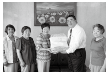
いきいき・サロンかがやき