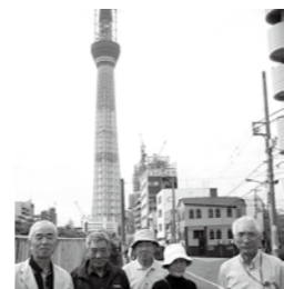
上河原団地仲良し会