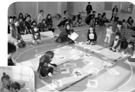
ちびっ子らんどの事業風景