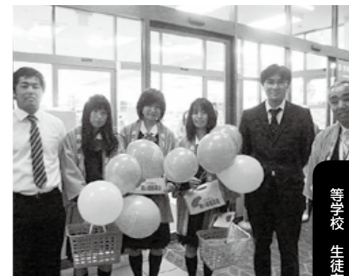
10月25日 「街頭募金協力団体」 ●募金活動協力/県立松伏高等学校 生徒有志の皆様