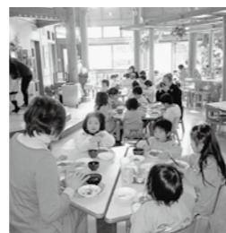
こどものもり ひなたぼっこサロン

ふれあい・いきいきサロン事業とは、町内の各地域において、高齢者などが気軽に寄り合える交流の場をつくり、地域住民が健康で生きがいを持ち安心して暮らせる地域づくりを目的として、各地域の協力者の支えにより実施する地域福祉事業です。松伏町社会福祉協議会で、本事業の拡大を図るため、新規設置及びサロン活動の協力者を随時募集しております。 (お問い合わせ先：松伏町社会福祉協議会 電話991-2701)