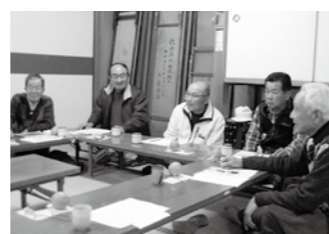
いこい・サロン内前野

ふれあい・いきいきサロン事業とは、町内の各地域において、高齢者などが気軽に寄り合える交流の場をつくり、地域住民が健康で生きがいを持ち安心して暮らせる地域づくりを目的として、各地域の協力者の支えにより実施する地域福祉事業です。松伏町社会福祉協議会で、本事業の拡大を図るため、新規設置及びサロン活動の協力者を随時募集しております。 (お問い合わせ先：松伏町社会福祉協議会 電話991-2701)