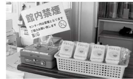
【B&G海洋センター】（石けん）

※かるちゃん石けんは、廃油を利用して作る石けんです。 油脂・泥よごれが良く落ちる石けんとして好評をいただいております。