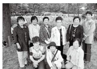
ほっと・サロン赤岩