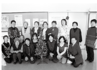
かがやき・ほほえみサロン